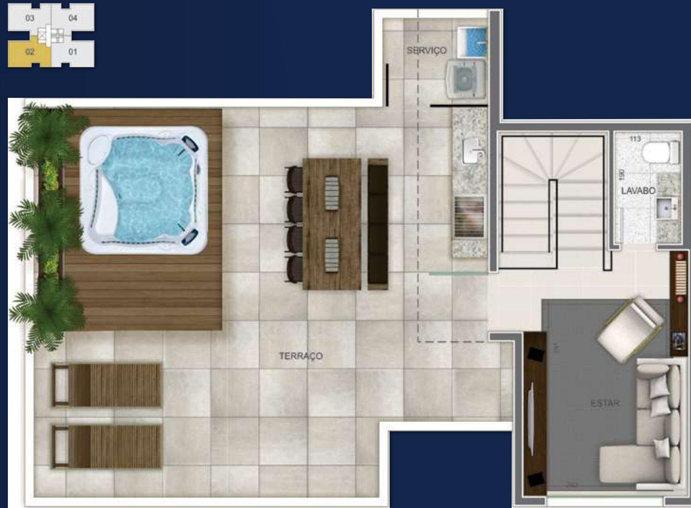
2º PAVIMENTO COBERTURA