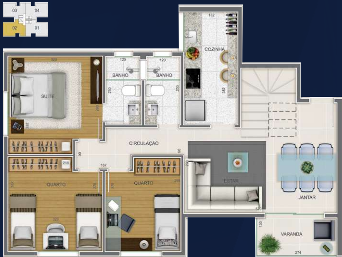
1º PAVIMENTO COBERTURA