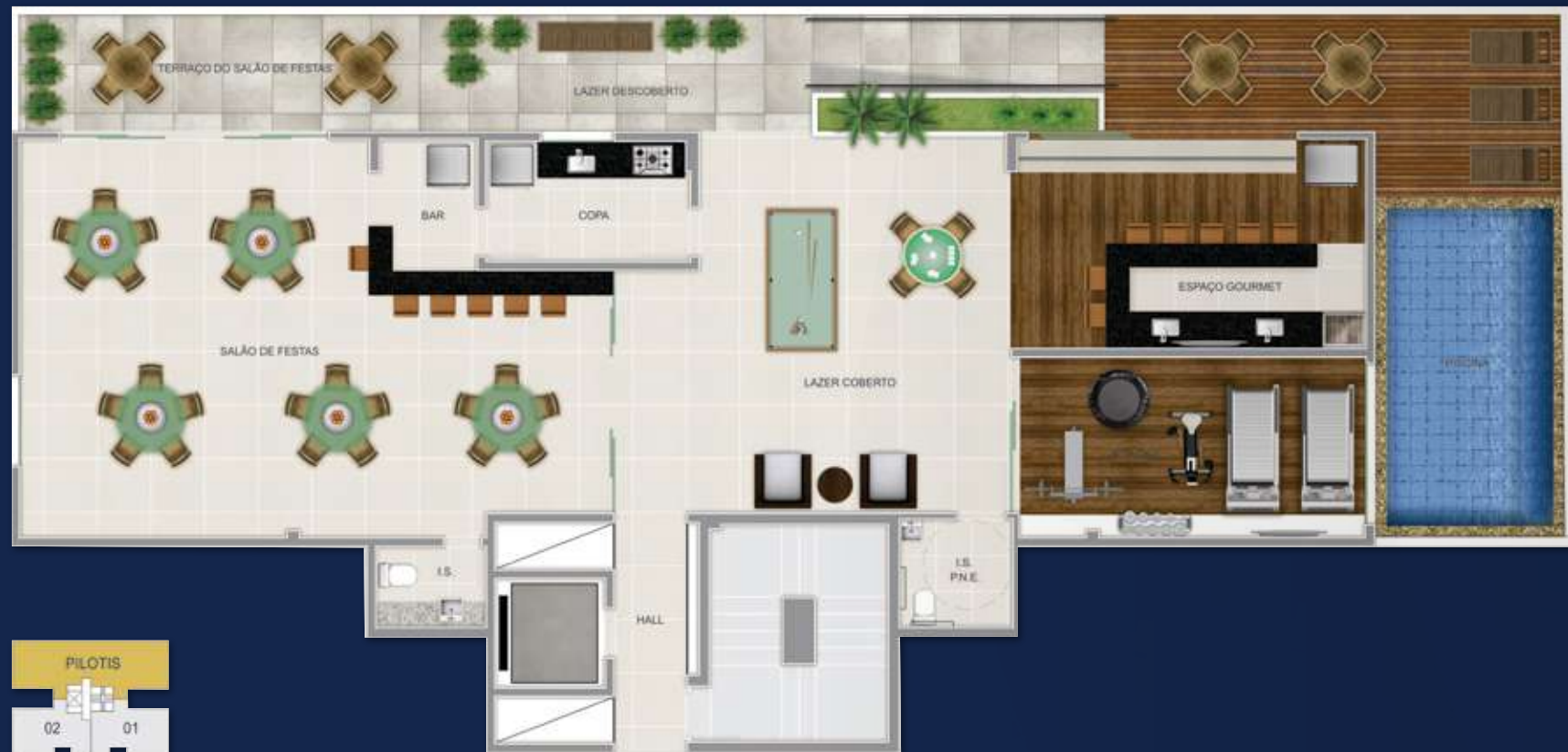
PILOTIS E LAZER